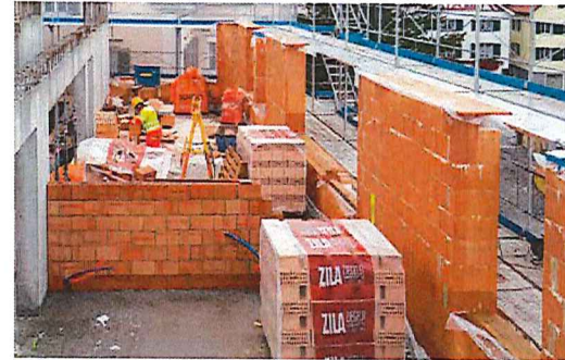
Men at work: Gerüste und Mauern wachsen unter fachmännischer Führung in kaum glaublichem Tempo in die Höhe.